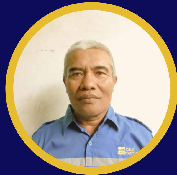
Gaos Martawijaya S PM Geoteknik