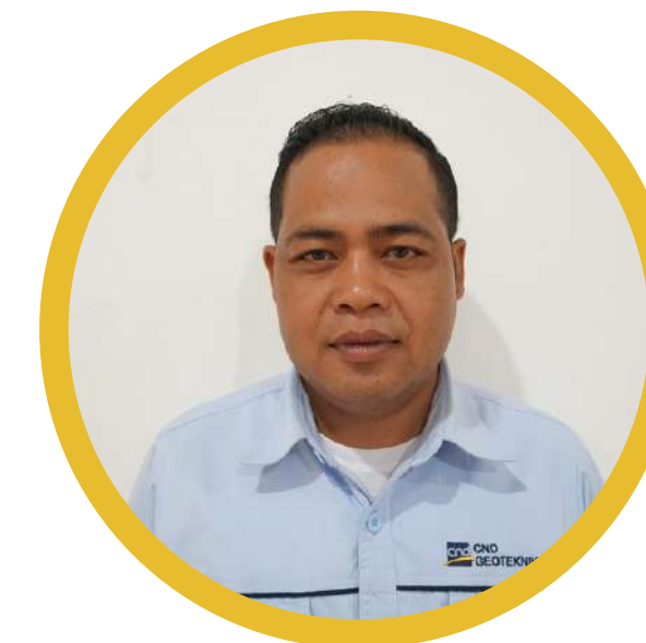
Jajang Hendriana Logistik