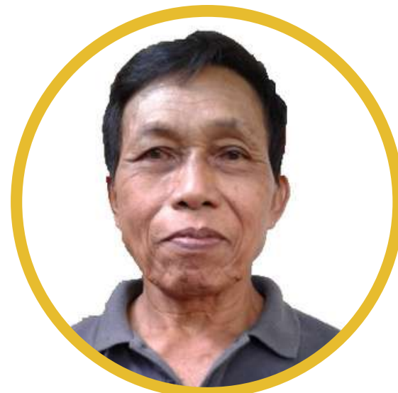
Misman Supervisi Grouting